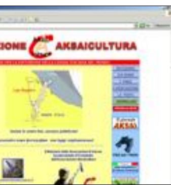
C'è un sito per saldare i rapporti fra Italia e Kazakistan