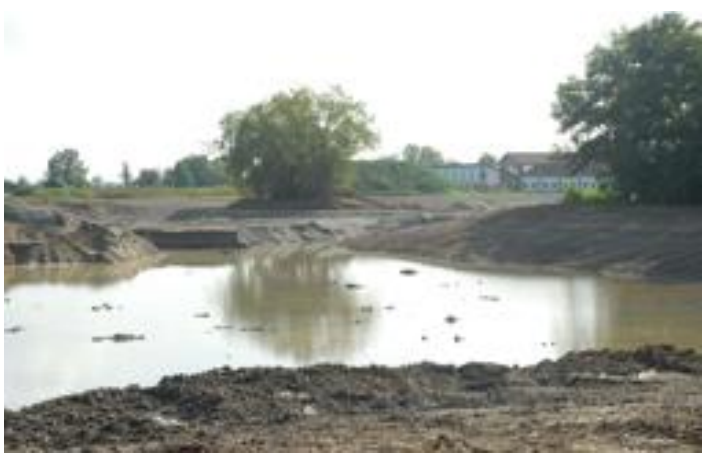
Il "laghetto" presso cascina Cassinazza dove dovrebbe sorgere un agriturismo